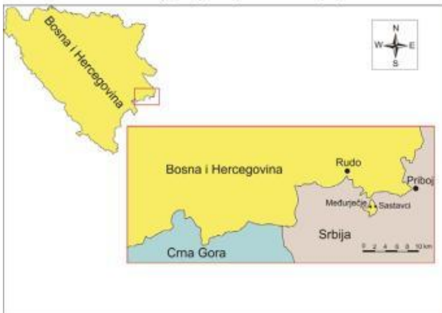
Slika 7. Geografski položaj eksklave Međurječje

Izvor: Geografski atlas za osnovnu i srednje škole, Sarajevo, 1998., str. 14-15; http://seosite.iankrosh.com/sastavci.htm (15.08.2015.)