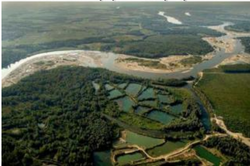
Slika 3. Meandriranje rijeke Drine u donjem dijelu toka