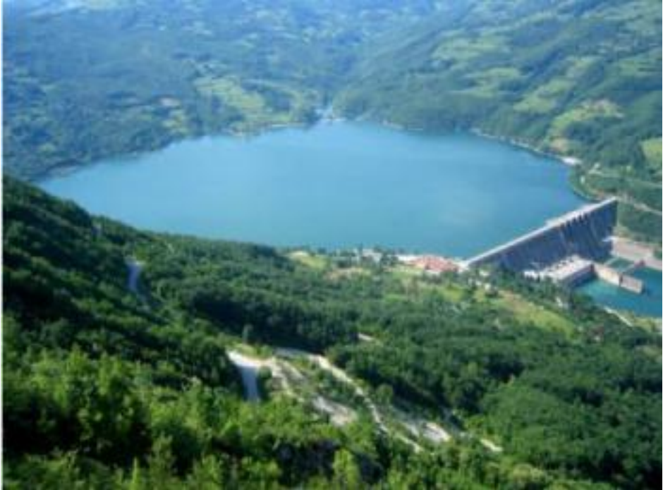
Slika 4. Hidroelektrana „Bajina Bašta