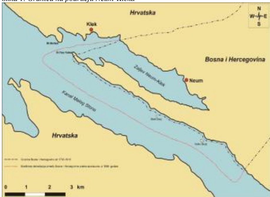
Slika 1. Granica na području Neum-Kleka