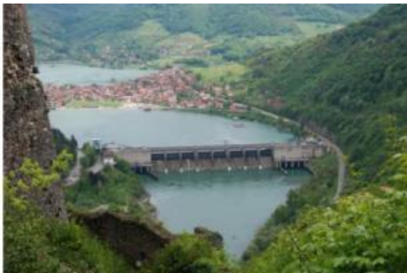
Slika 5. Hidroelektrana „Zvornik“