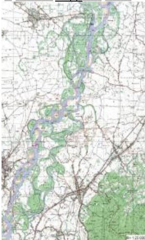
Slika 2. Donji tok rijeke Drine između Janje i Anuijlja